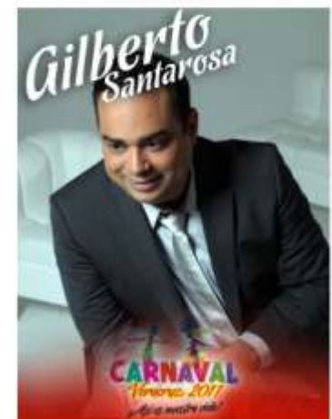
Martes 08 de Marzo, 22:00 horas