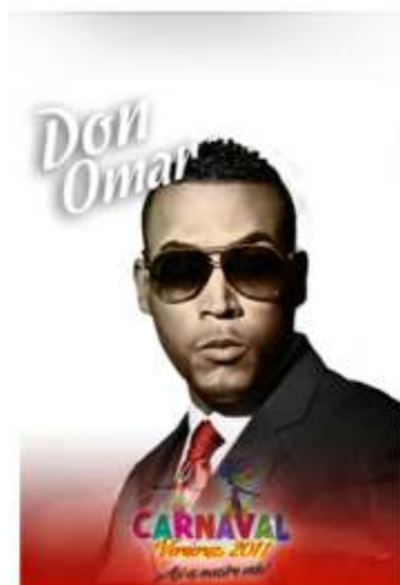
Lunes 07 de Marzo, 22:00 horas

22:00 Hrs. Macroplaza del Malecón. Don Omar.