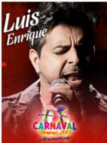
Sábado 05 de Marzo, 22:00 horas

22:00 Hrs. Macroplaza del Malecón. Yuri.