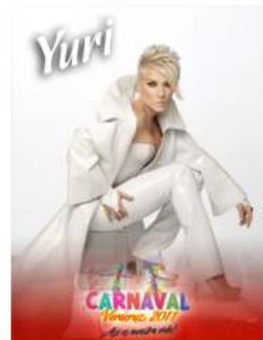
Domingo 06 de Marzo, 22:00 horas