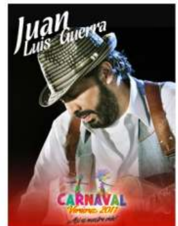
Miércoles 09 de Marzo, 21:00 horas

21:00 Hrs. Macroplaza del Malecón. Juan Luis Guerra.